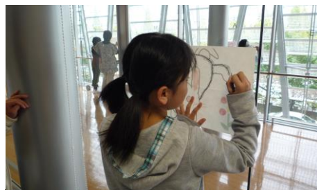
◇描いた絵をプリントしてトレースの準備して木板に鉛筆で写し取る