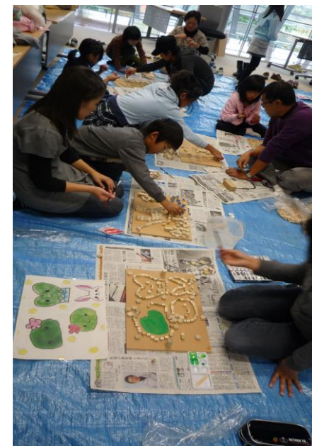
◇作品制作・参加者の作品