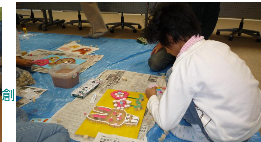
◇木のブロックを使って立体的に浮き出す絵の制作。