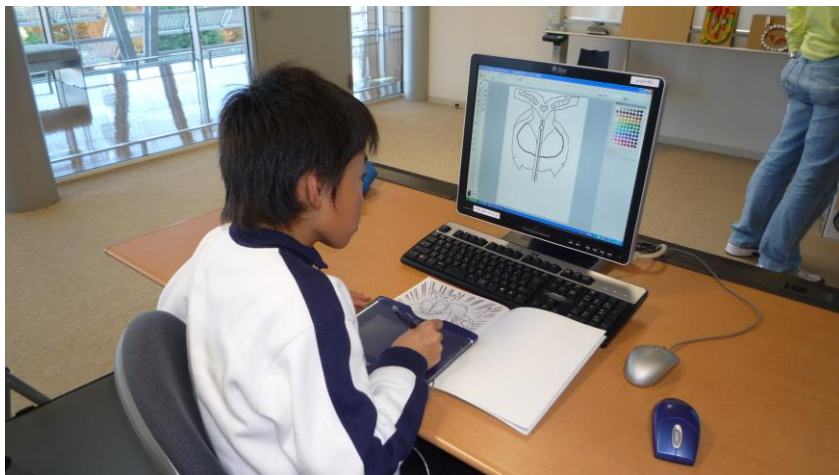
◇パソコンを使って手描き感覚の作品制作。