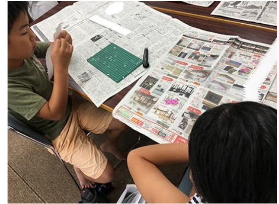
◇細かなパーツづくりの風景