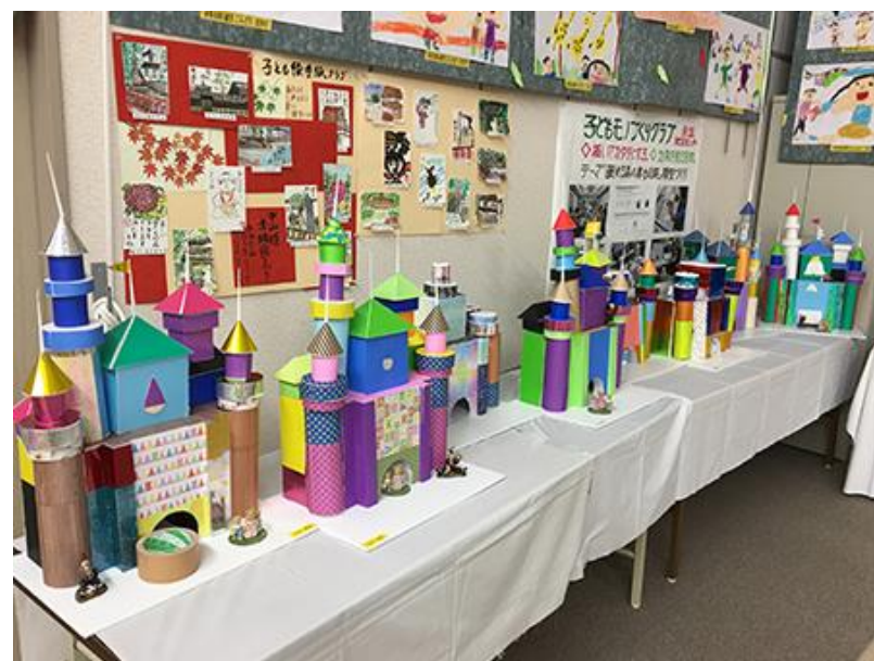
赤坂地区センター「三世代ふれあいの集い」展示