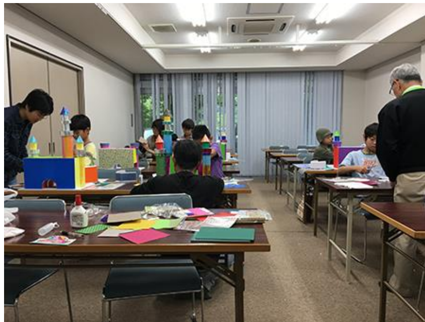
生徒の素晴らしい「わたしの「眠れる森の美女の城」模型作品